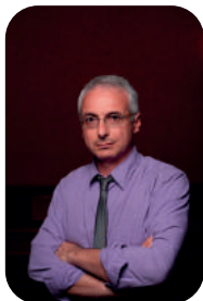
Valter Orsi Sindaco di Schio